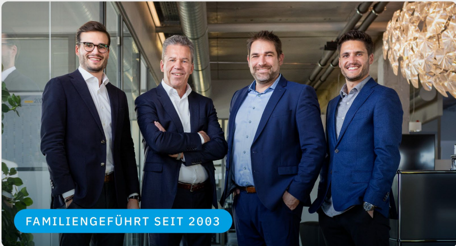
FAMILIENGEFÜHRT SEIT 2003