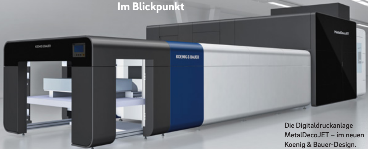
Die Digitaldruckanlage MetalDecoJET – im neuen Koenig & Bauer-Design.